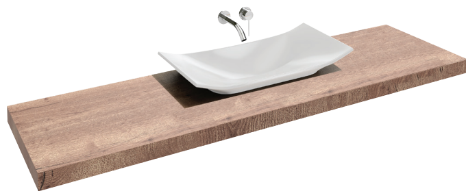
Collection : PARALLEL